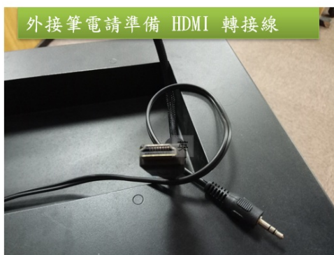
外接筆電請準備 HDMI 轉接線