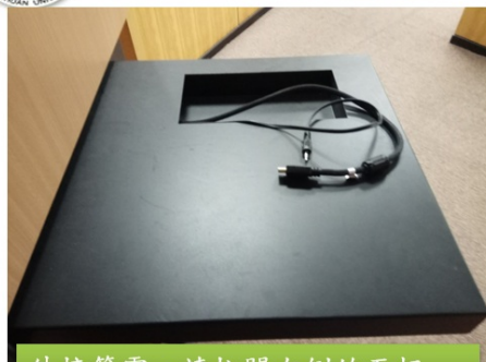
外接筆電，請拉開右側的面板